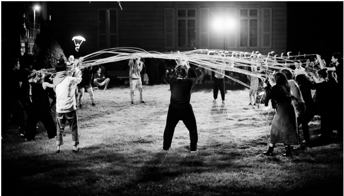
Formation autour de Corde encadrée par Beatriz Navarro et Juri Cainero au CCHAR - Centre de Création Helvétique des Arts de la Rue, La Chaux-de-Fonds (Suisse), août 2024