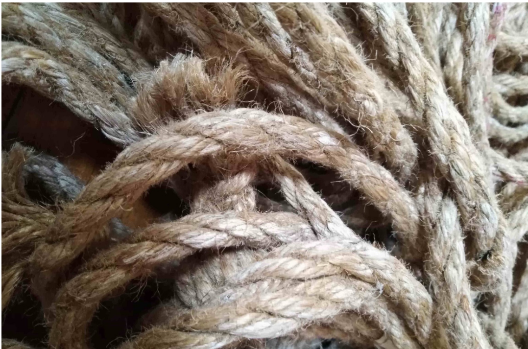
Vue de détail des cordes utilisées dans le dernier spectacle de la Cie Onyrikon, intitulé Corde (création 2025)