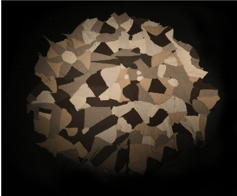
Couverture cousue par Beatriz Navarro à partir des bouts de laine récoltés à Longo Mai pour la création de Urdimbre (2024)