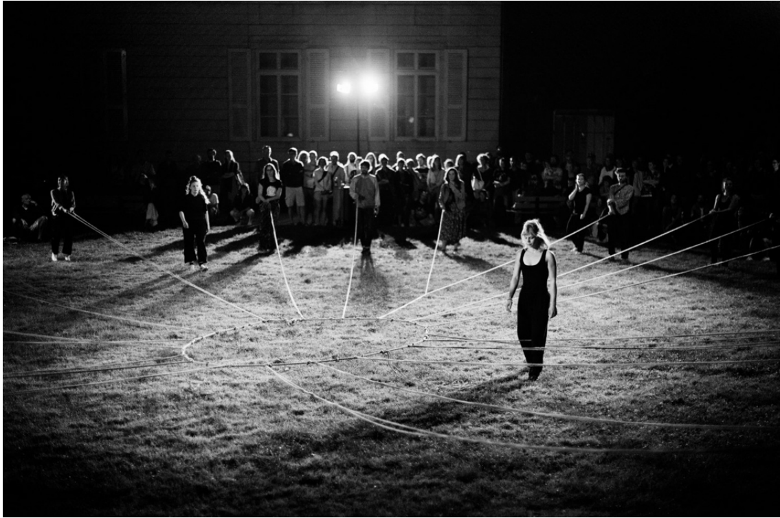
Formation autour de Corde encadrée par Beatriz Navarro et Juri Cainero au CCHAR - Centre de Création Helvétique des Arts de la Rue, La Chaux-de-Fonds (Suisse), août 2024